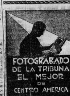
FOTOGRAFADO DE LA TRIBUNA EL MEJOR DE CENTRO AMERICA